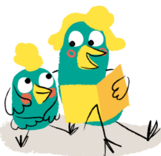
Illustration : © Mylène Rigaudie / Milan Presse 2020.

Développer son autonomie : des documentaires pour répondre à ses interrogations, des magazines qui l'aident à s'affirmer et à s'épanouir.