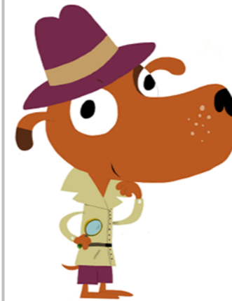
Illustration : © Hélène Convert, d'après un personnage créé par Nathalie Choux / Milan Presse 2020.

MANON MAXI LECTURE Des hors-séries, en plus de l'abonnement, pour encore plus de récits et de BD qui font rêver et sourire !